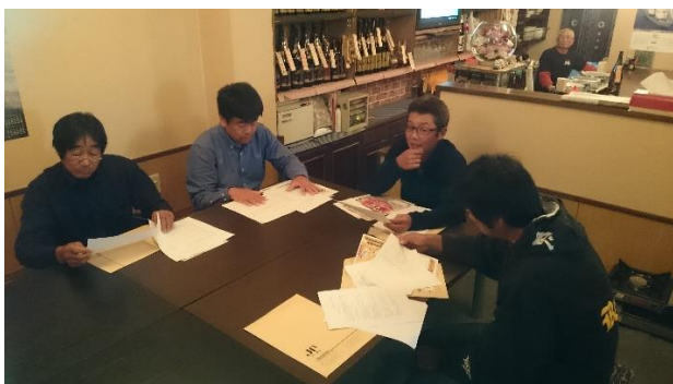
協議会総会の様子