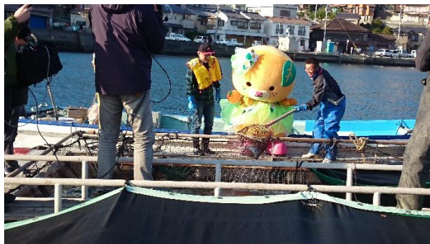
「みきゃんのとくてく愛媛うまいもん編」に出演