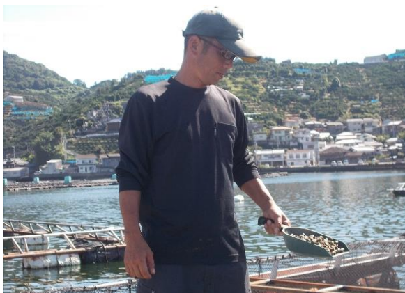
マダイへの給餌作業

そこで、同じ境遇に悩まされているマダイ養殖の後継者に声掛けをして、総勢 6 名で平成 28 年 4 月に「 八幡浜漁協ブランド推進協議会 」を結成して、その会長となりました。先ず取り組んだのが、平成 28 年度の 生産コスト削減のための低魚粉飼料の開発 でした。これには県の補助事業を活用し、一般的な飼料では 40～50%程度含まれている魚粉を 20%と 30%に削減した飼料の開発に成功しました。平成 29 年度には協議会の単独事業として、低魚粉飼料に肉質改善剤を配合した飼料を開発し養殖試験に取り組み、さらに 肉質、味の良いマダイの生産に成功 しました。平成 30 年度にも県の補助事業を活用し、この 養殖方法をマニュアル化 して、協議会構成員が生産するマダイの質の均一化を目指し、 ブランド化に取り組みました 。その成果として、「八幡浜産業まつり」に出展、さらには「シーフードショー大阪」へも出展して、それぞれ来場者への食味試験によるアンケート調査を行い、 好評な結果を得ることができました 。これを起爆剤として、協議会は生産だけでなく マーケティングへも乗り出し 、大きく躍進することとなりました。