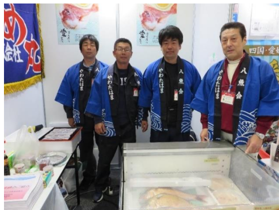
シーフードショー大阪への出展