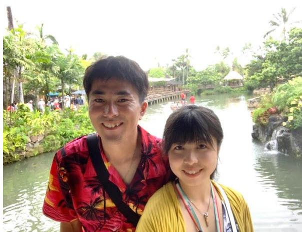
新婚旅行でハワイに！