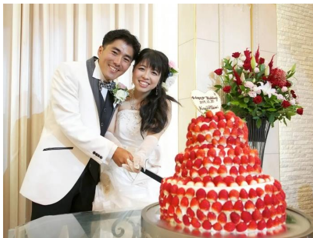
結婚式のケーキには「かんちゃん農園」のイチゴを使用