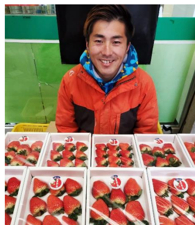
パック詰めしたイチゴ