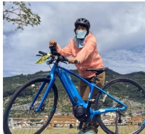
休日はカメラを片手に撮影やサイクリングなどもします