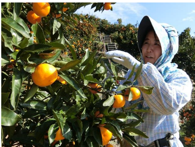
真穴地区のみかん山で収穫作業

また、大好きな地域のこと、みかんの生育状況などをインターネットにアップするかたわら、自分で撮影した写真を使って写真集やマスクケースなどのオリジナルグッズを作り、 消費者への PR 活動を展開 しています。