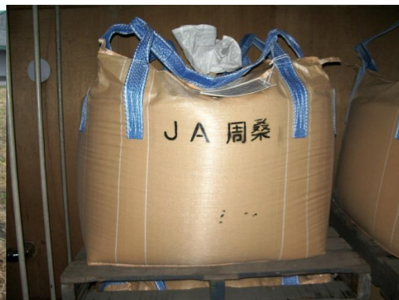
フレコンバック（米 600 kg）による出荷