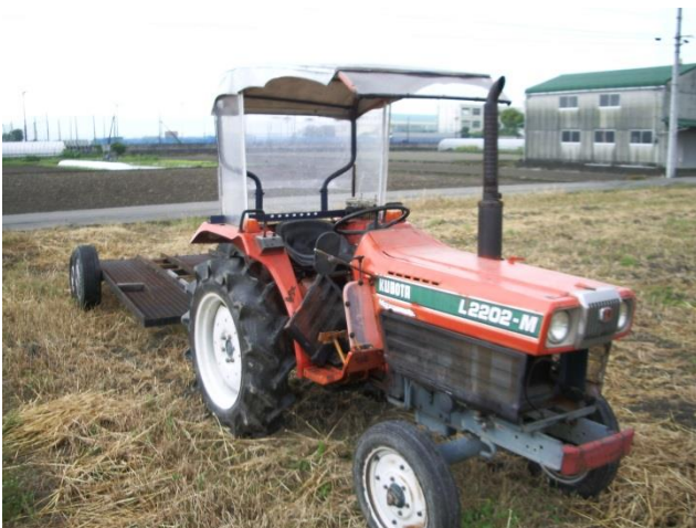
メンテナンスを終えたトラクター

両親が農業を行っていたことから、農業を身近に感じていました。建具職人に 8 年間従事したのち、就農しましたが、この時の経験が、農業機械等の修理、メンテナンスに大変役立っています。