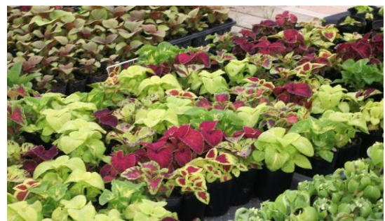
丹精込めて作られた花き類