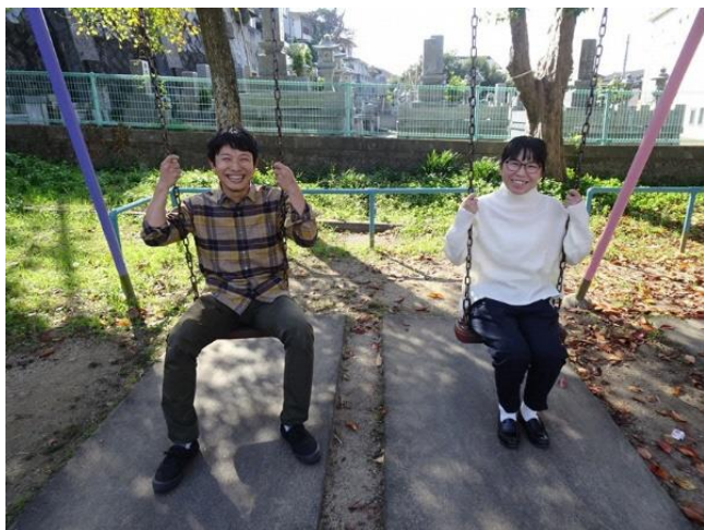
農業を通じて出会った奥さんと