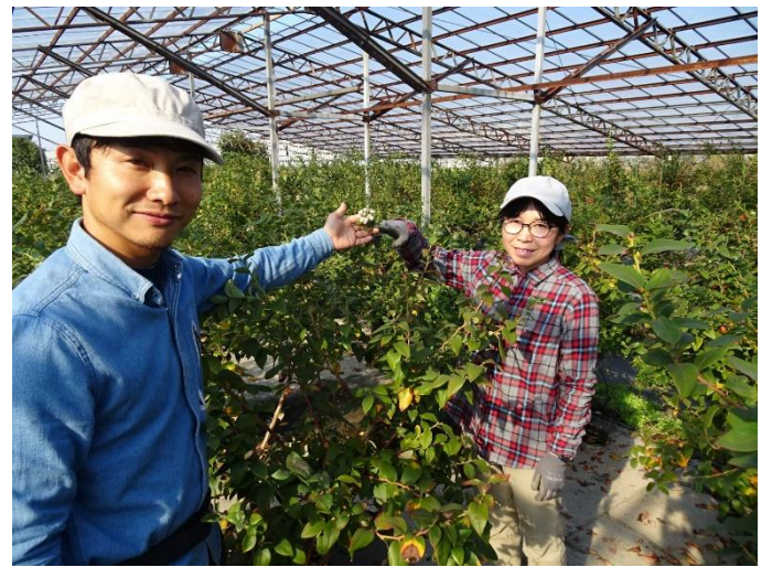
既存の施設を利用したブルーベリー栽培