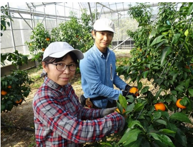
紅まどんなの収穫の様子

JAえひめ中央青壮年部小野支部の一員でもあり、園地視察や意見交換などを通じ、農業経営の発展を目指しています。