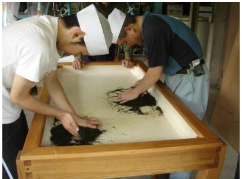
手もみ技法による製茶