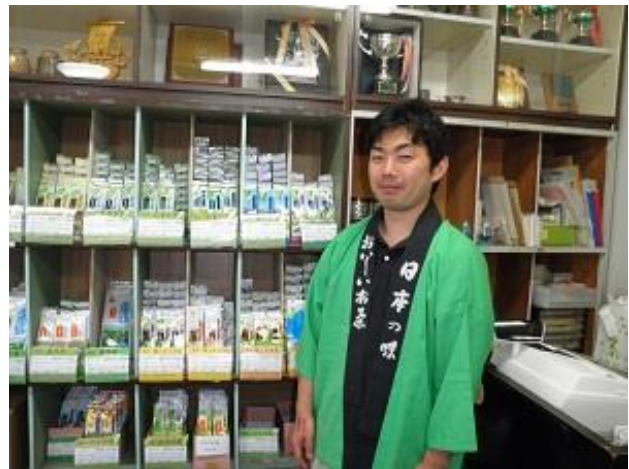
製茶場敷地内の直売店舗