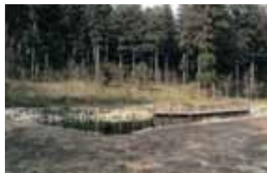
3 避難小屋・憩いの広場