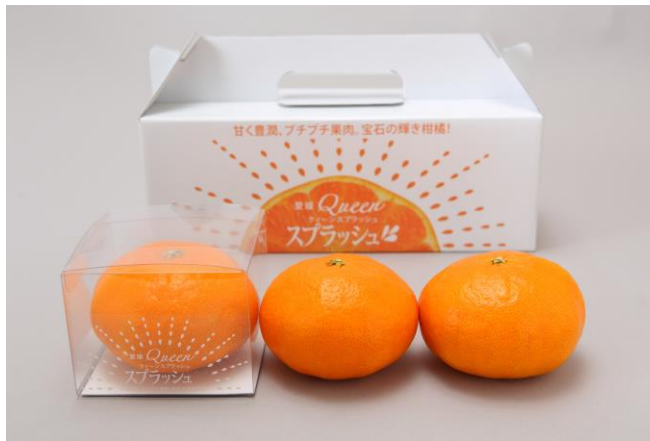
【3個箱および個包装資材】