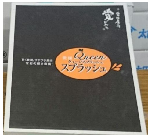
【出荷団体の出荷箱】