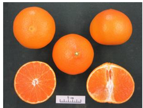
紅プリンセスの果実