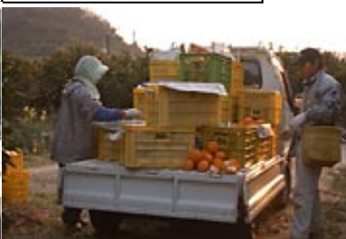
軽四トラックによる運搬