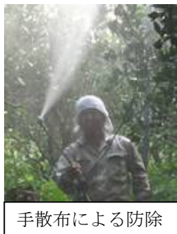
手散布による防除