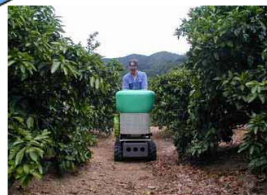
施肥散布機による施肥