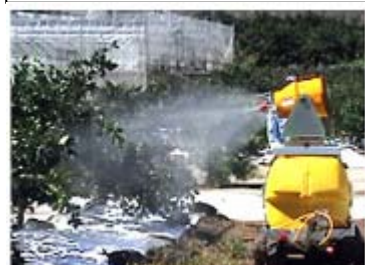
風筒式防除機による防除