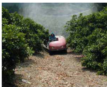
ステートスプレーによる防除