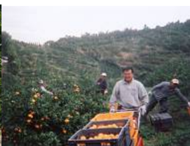
運搬車による運搬