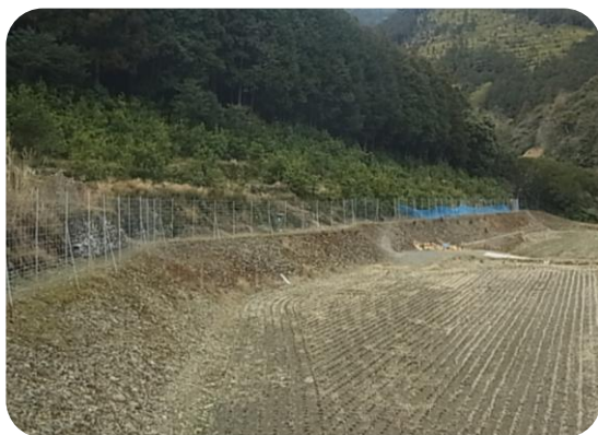
整備したほ場の周囲に鳥獣害防止柵を設置