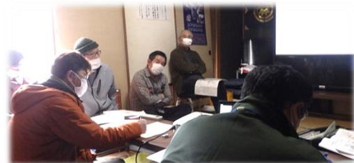
地域住民による話し合い（四国中央市）

地域の課題を洗い出し、地域が目指す将来像の実現に向けた道筋等をまとめた「ふるさと保全計画」を策定しています。