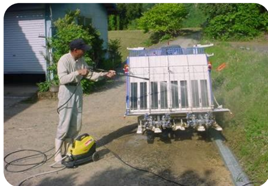
営農飲雑用水施設の整備による 洗浄水等の確保（大洲市）