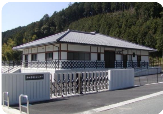
農業集落排水施設の整備（西予市）

生活環境の向上や集落機能の維持・強化に向けた集落道路の整備、排水対策、営農飲雑用水の確保、汚水処理施設の整備などを推進します。