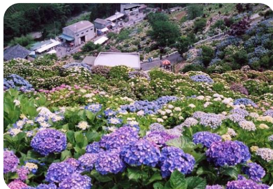
景観作物の作付け(四国中央市)