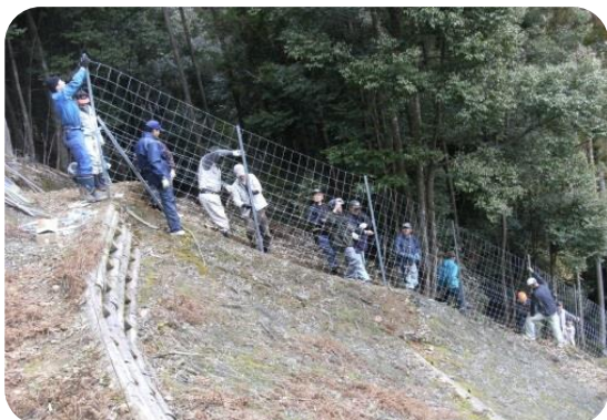
鳥獣被害防止活動(松野町)