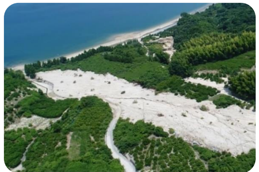
今治市上浦町盛 (大三島)