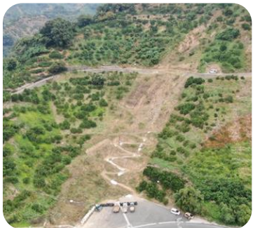
宇和島市吉田町白浦