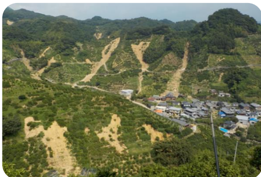
宇和島市吉田町白浦