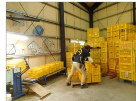
倉庫内で軽労働化調査