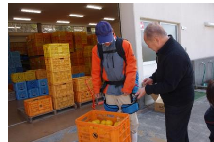
アシストスーツ着用