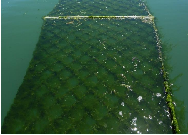
アオノリ養殖のようす

愛媛県では駄菓子や高級和菓子に使用される「アオノリ」が養殖されていますが、生産量は減ってきています。