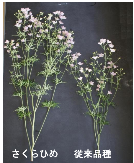
さくらひめ 従来品種