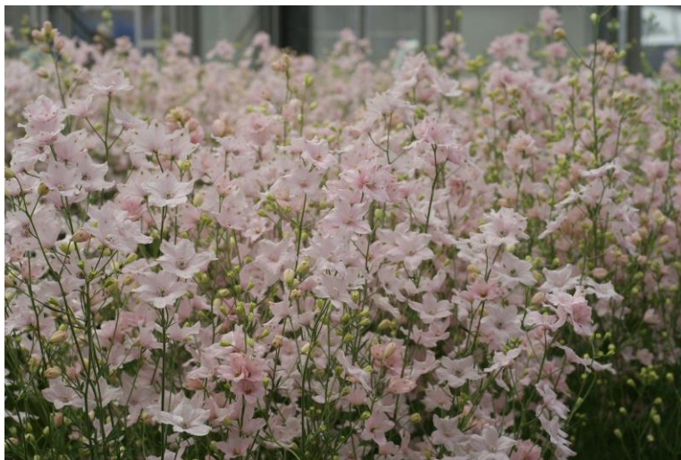
出荷前の‘さくらひめ’