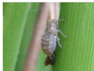
トビイロウンカ 短翅雌成虫