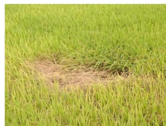
トビイロウンカによる 坪枯れ