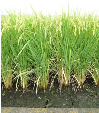
媛育 71 号の草姿