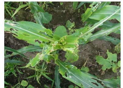
スイートコーンの被害

殺虫剤の使用に当たっては、登録内容を遵守してください。また、抵抗性の発達を防ぐため、同一系統の薬剤の連用は避けてください。