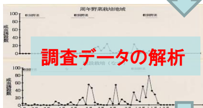
調査データの解析