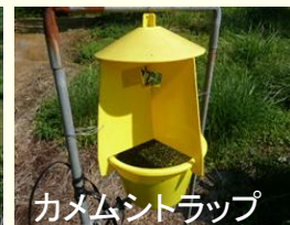
カメムシトラップ