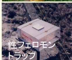
性フェロモン トラップ