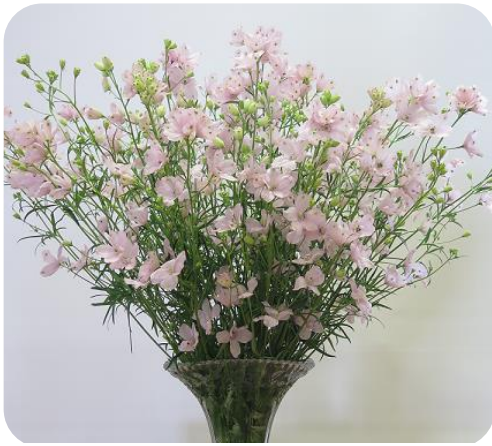
県育成品種 ‘さくらひめ’