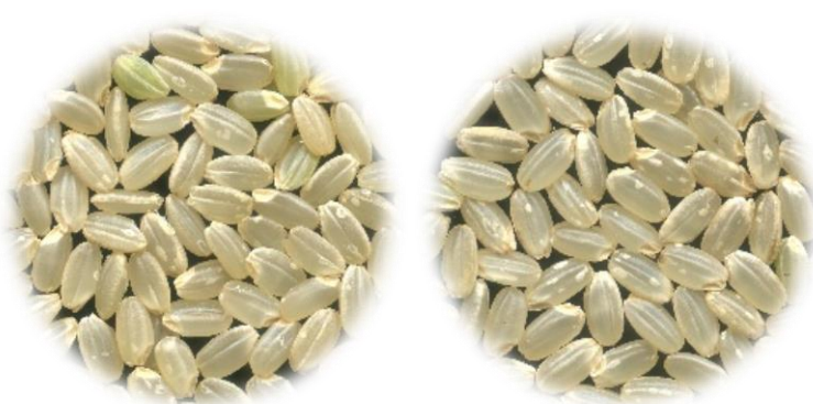
玄米(左‘媛育84号’、右‘ヒノヒカリ’)