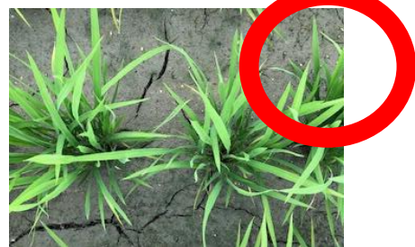
田面に小ヒビが入った水田