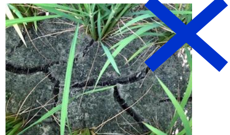
田面に大ヒビが入った水田