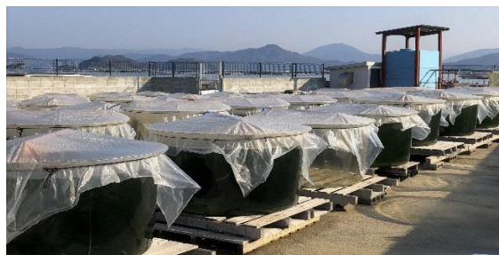
図2 養殖現場と打ち抜き井戸

そのため、海や河川の養殖場では出来なかった『甲殻類アレルギーフリー』の安心安全なスジアオノリの生産が可能となりました。