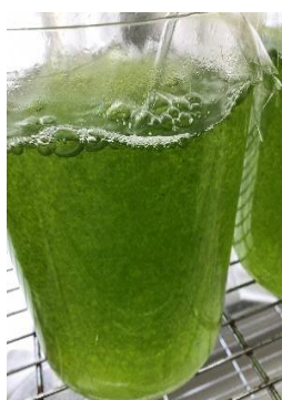
図 4 培養室内