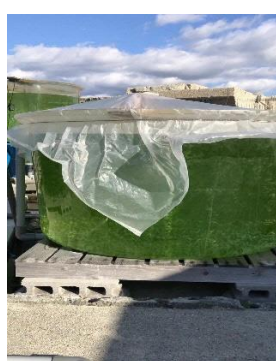
図 5 第一養殖場