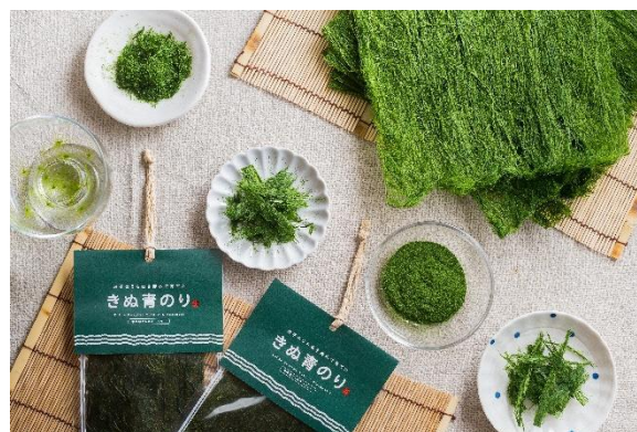
図 6 商品「きぬ青のり」