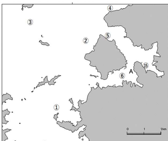
宇和島湾調査定点