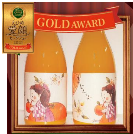
【有限会社 国光農園】 あい果28号