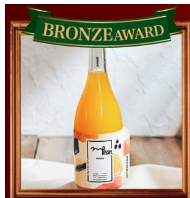
【MOURI FARM】 MOKAN 温州みかんジュース

段々畑が広がる、気候に恵まれた明浜で、個性豊かな生産者が育てたみかんの100%ストレートジュースです。