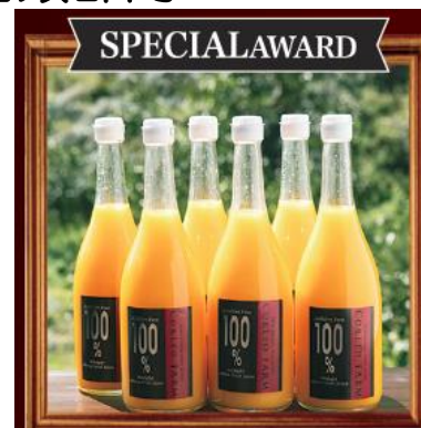
【コレオファーム】 シトラスフルーツジュース

せとかの華やかな香り、甘味と酸味のあるしっかりとした味わい。濃いオレンジの色味が自慢の一品です。