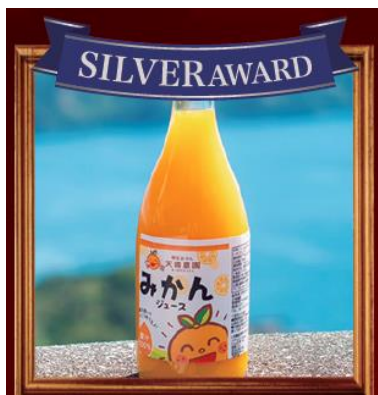
【天晴農園】 あっぱれ 天晴みかんジュース