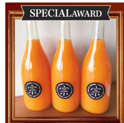
【宗方印】 宗方印のみかんジュース 花みかん

園地や栽培方法にこだわり厳選した小玉みかんを使用しています。贈り物にも喜ばれるデザインにしました。