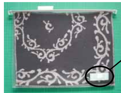
図1 ファイルに添付したICタグ