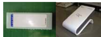
図2 ICタグ(左)とリーダライタ(右)