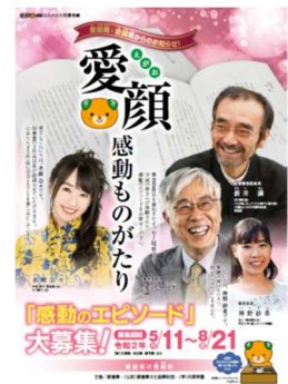
愛顔感動ものがたりちらし

損害保険業という職種柄、様々な事故、災害と向き合うケースも多く、今回仕事の中で愛顔を考えるきっかけとなりました。