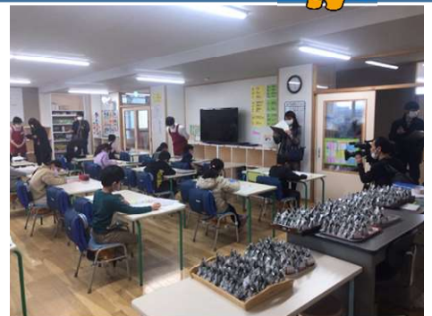
3月10日学童施設への配達の様