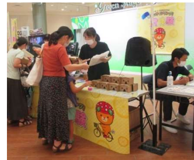
イベント実施の様子

愛媛県自転車安全利用促進条例施行7周年イベントとして、自転車安全利用啓蒙のためのVR体験イベントを開催しました。VRやシュミレーターを通して交通安全に係るルールやマナーを楽しく学んでいただくことができ、自転車安全利用の促進を図ることができました。