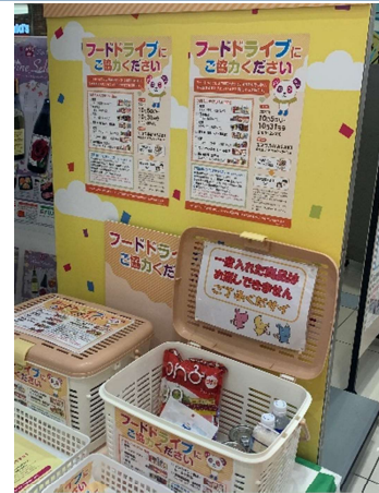
フードドライブ実施の様子

環境への負荷が少ない資源循環型社会のモデルとなるようなリサイクル製品や廃棄物の3R(リデュース・リユース・リサイクル)の取組みを紹介する「愛媛県の3Rフェア」を開催しました。会場内では10月の食品ロス削減月間に合わせて、家庭等で余っている食品をお持ち寄りいただくフードドライブコーナーも設置し、集まった食品は後日、フードバンク団体にて子ども食堂や福祉施設等に寄附させていただきました。