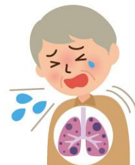
日本歯科医師会HIP参考