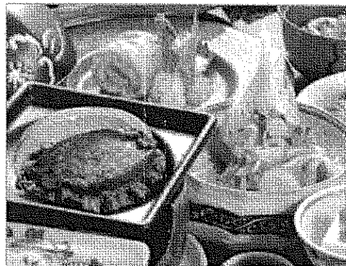
坊ちゃん鳥アワビと地鶏のコラボ♪堪能してください！

※料理内容は仕入状況等により多少異なる場合がございます。 ※朝食はレストランでバイキングとなります。 (状況によって和食のセットメニューになる場合がございます。)