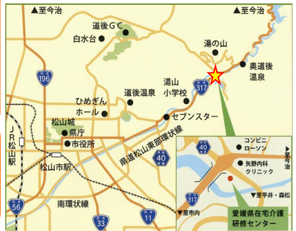
【当センターの周辺図】