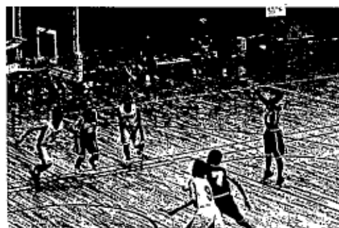
▲渾身のシュートを放つ選手