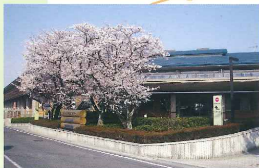
（子ども療育センター）