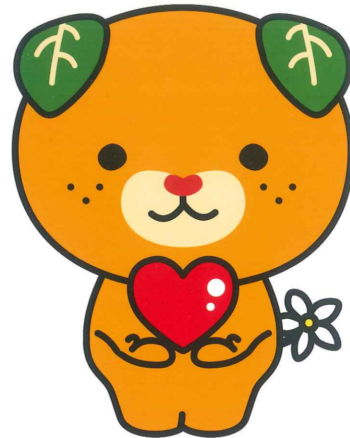
愛媛県イメージアップキャラクターみきゃん

愛媛の人びとを愛で結び、支援の輪を拡げていきたいという願いから「あい♡ゆう」と名づけました。