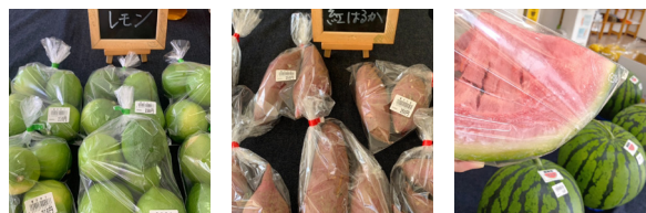
地元農家の規格外の野菜や果物などを委託販売し、地産地消を推奨