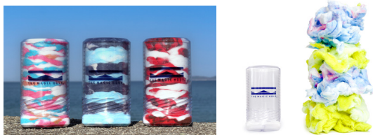
西染工株式会社のスゴeco認定製品「今治のホコリ」を取り扱う