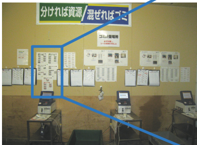
●リサイクルルーム計量コーナー