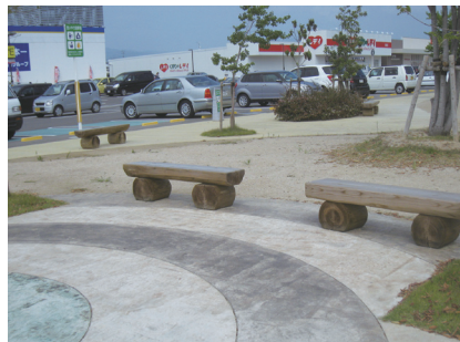
県産間伐材を使用したベンチを設置