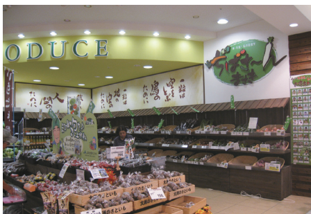
●生産者コーナー (ぎばさんまさき)

約200のグループ・2,000名の従業員が同じ基準でゴミの分別ができるように、クリーンルームにはスタッフが常駐し、分別・計量方法を指導するほか、適宜分別説明会を開催しています。