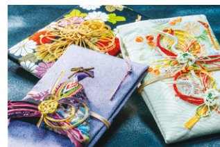
着物地を活かしたご祝儀袋

生まれたこの取組みは、廃棄物削減と資源の有効活用に貢献するとともに、海外でも取り入れやすい日本文化の製品として評価されています。