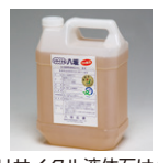
リサイクル液体石けん