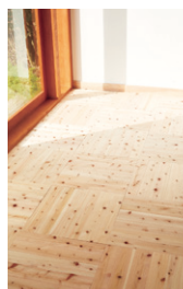
床： はれるんです桧生節