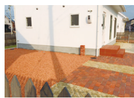
洋風建築との相性も抜群