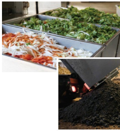
①食品残渣・工業汚泥の受入