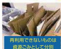
再利用できないものは 資源ごみとして分別