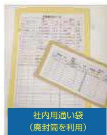
社内用通い袋 (廃封筒を利用)