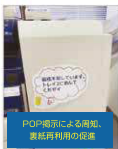
POP掲示による周知、 裏紙再利用の促進

両面・nアップコピーの習慣づけ、裏紙再利用徹底による紙の使用削減(裏紙使用率 約30%)