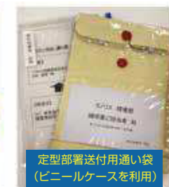
定型部署送付用通い袋 (ビニールケースを利用)