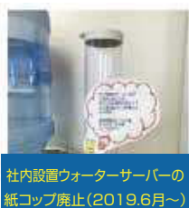
社内設置ウォーターサーバーの 紙コップ廃止(2019.6月~)

両面・nアップコピーの習慣づけ、裏紙再利用徹底による紙の使用削減(裏紙使用率 約30%)