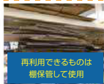
再利用できるものは 棚保管して使用