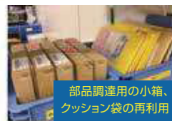
部品調達用の小箱、 クッション袋の再利用