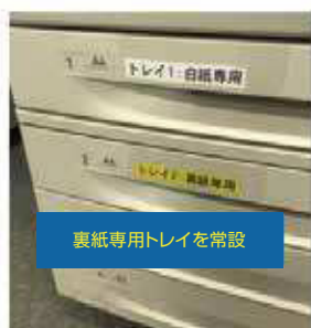
裏紙専用トレイを常設