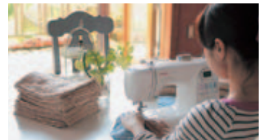
家事や育児優先の在宅勤務の導入