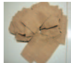
発生したハギレは別の商品に活用