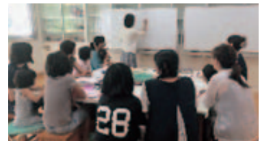
女性を対象にしたセミナーの実施