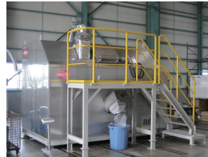
紙おむつ処理装置

使用済み紙おむつを高温殺菌乾燥し、一般廃棄物処理を可能とする、もしくは固形燃料の原料とする装置