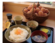
「熊福」のたまごかけ 御飯定食