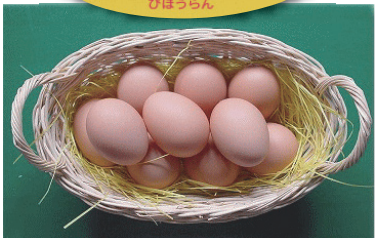
自社ブランド卵「美豊卵」