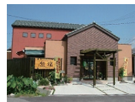
直営ショップ「熊福」 (愛媛県認定優良エコショップ)