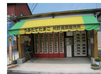
卵の直売所 (自動販売機)