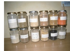
副原料(海藻粉末、ガーリック等) や配合飼料等を混合