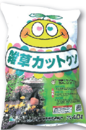
雑草カッタくん： 土壌改良材(敷料) 堆肥化