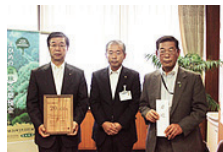
オフセットクレジット 「J-VER」購入

愛媛銀行、愛媛県、愛媛の森林基金の 3者による森づくり活動協定に基づく 「愛媛銀行ecHoの森」の整備活動や、 森林での体験学習を実施