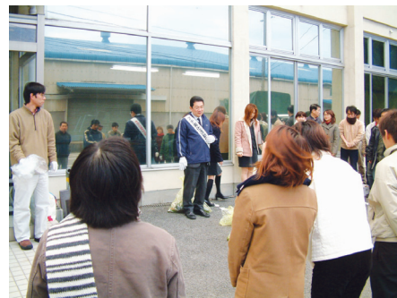
社員による清掃奉仕活動