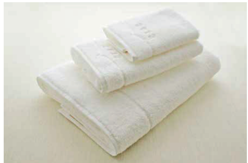
オーガニック綿製の製品「風で織るタオル」