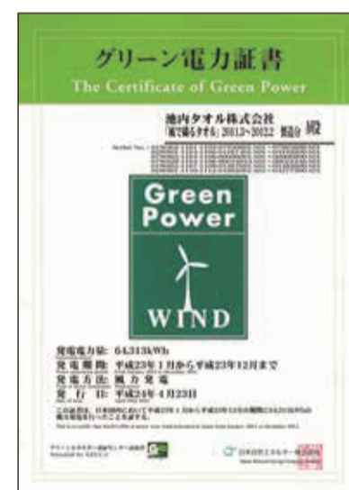
グリーン電力証書