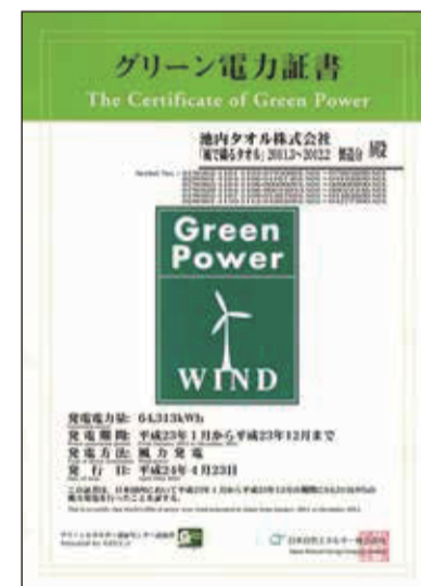
グリーン電力証書