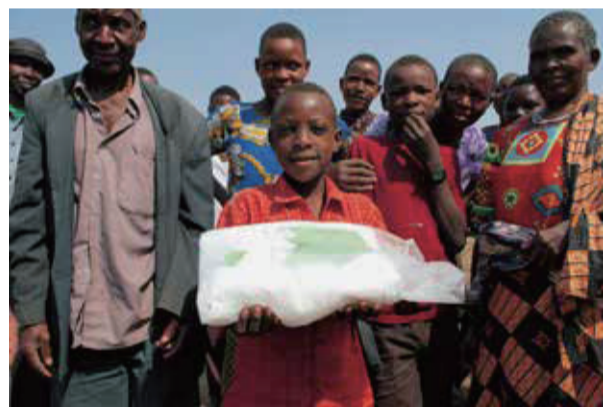
オーガニック綿の生産風景

更に、グリーン電力証書システムにより風力発電の電力を使うこととし、年間25万キロワット時の契約を結んで、使用電力の100%をグリーン電力でまかっています。