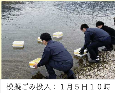
模擬ごみ投入：1月5日10時