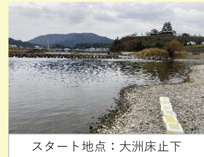
スタート地点：大洲床止下